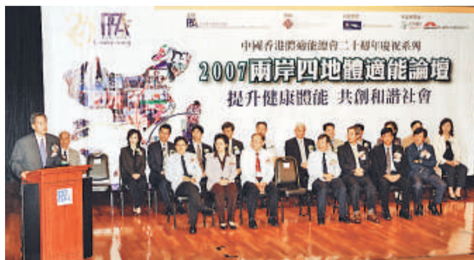
▲本會邀請兩岸四地專家學者，共同草擬「體力活動與健康的共同聲明」，並於「2007兩岸四地體適能論壇」聯合簽署。聲明內容提及兒童、青少年、成年人及肥胖人士針對性的運動建議（包括運動種類、強度、每周參與頻次及每次持續時間）。並且，重點指出體力活動對不同年齡人士的健康價值。