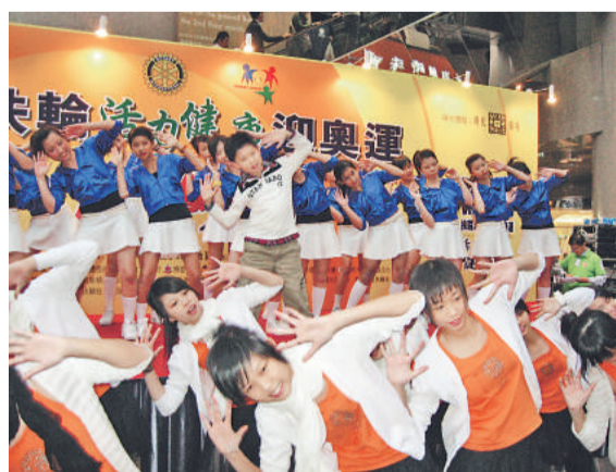
▲為配合迎接2008北京奧運，本會獲國際扶輪3450地區（香港、澳門及蒙古區）的邀請，聯同教育局及港協暨奧委會，成為「扶輪活力健康迎奧運」的主要支持機構，負責設計一套極富趣味的「扶輪活力健康操」，並派員指導各幼稚園及中小學的師生參與，透過參與全民運動支持2008北京奧運，活動得到超過十四萬名學生及市民參與。

中國香港體適能總會定期舉辦體適能導師及教練員培訓課程，按時出版會訊及體適能刊物。此外，亦協助各類型機構、社區團體及學校舉辦體適能活動，並提供體適能顧問及諮詢服務。