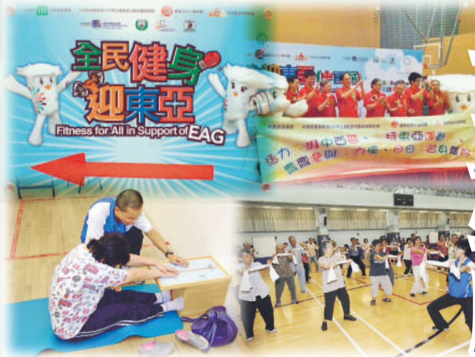
▲為響應今年8月8日國家全民健身日、支持香港2009東亞運動會及進一步推廣「普及體育」，香港特區政府於當天在全港18區舉辦「全民健身迎東亞」活動，向香港市民推廣體育運動的基本知識，鼓勵市民參與健身運動。本會派出180名教練負責體適能測試及諮詢、體操同樂及器械體操同樂。